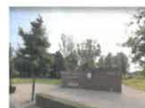
Parochiecentrum Dreef 149, Leut