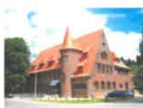
DC De Bolster Kastanjelaan 61, Eisden