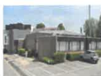
Gemeenschapscentrum Hoekstraat 1, Opgrimbie