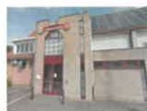
Zaal Concordia Oude Baan 205A, Mariaheide